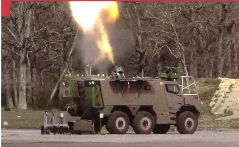
Tir d'essai réalisé par la Délégation générale pour l'armement (DGA) au début de cette année avec l'engin prototype.