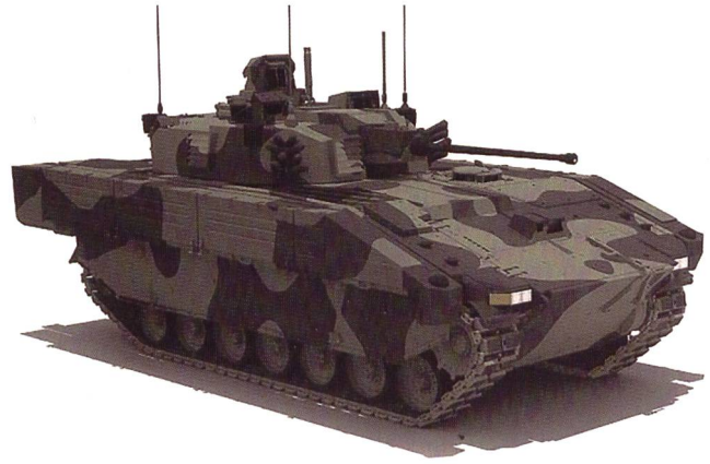
Image de synthèse montrant la configuration de l' Ajax et de sa tourelle de 40 mm.

Aperçu de la famille d'engins, avec les versions spécialisées dans le domaine de la reconnaissance et du Génie.