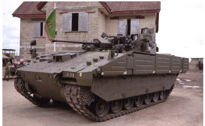
Essais à la troupe de la version de reconnaissance et de combat.

La version VTT a également fait l'objet de certaines évaluations, avec une douzaine d'engins livrés.