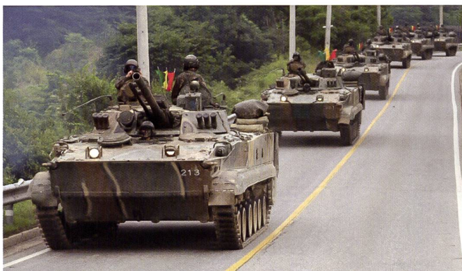
Ci-dessus : Le VTT K200 est un M-113 amélioré (en haut). Le VCI BMP-3 est d'origine russe.