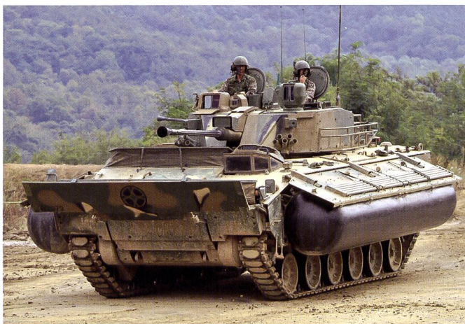
Ci-dessous : Le K21 est un véhicule de combat d'infanterie développé localement. Ses performances sont élevées mais... remarquez sa taille importante face au M2 Bradley – qui est lui-même déjà très imposant.