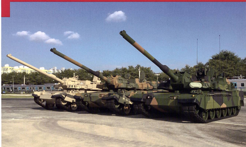
Evolution du char de combat sud-coréen K2. L'engin du centre est en service national et celui de droite est la configuration norvégienne, reconnaissable à son système anti-missiles Trophy.