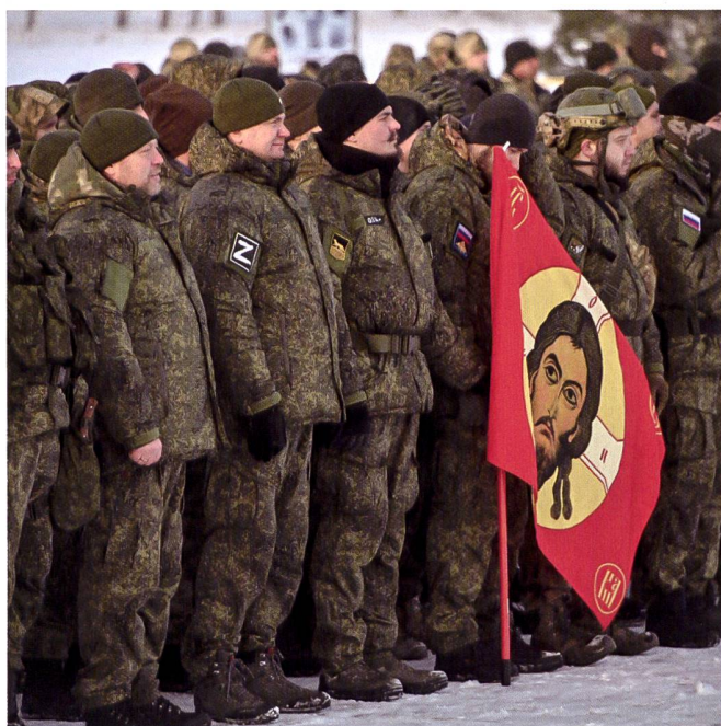
Ci-dessus, illustrations de la formation des réservistes et des conscrits en Russie.

une semaine, leurs faiblesses ont elles aussi été révélées : autonomie et chaîne logistique limitées, exploration et capacités de conduite et de planification trop faibles, manque de réserves à tous les échelons (y compris le personnel et les équipages de réserve), insuffisance quantitative des cadres subalternes et de leur capacité à conduire leur unité de manière coordonnée.