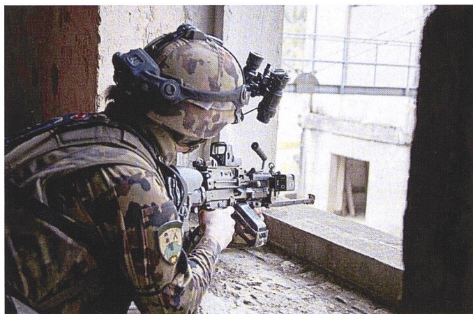
Assaut d'un bloc de maisons par des éléments de la compagnie de fusiliers de montagne 7/3, dans le village d'exercice du Day (VD) le 6.05.2023.