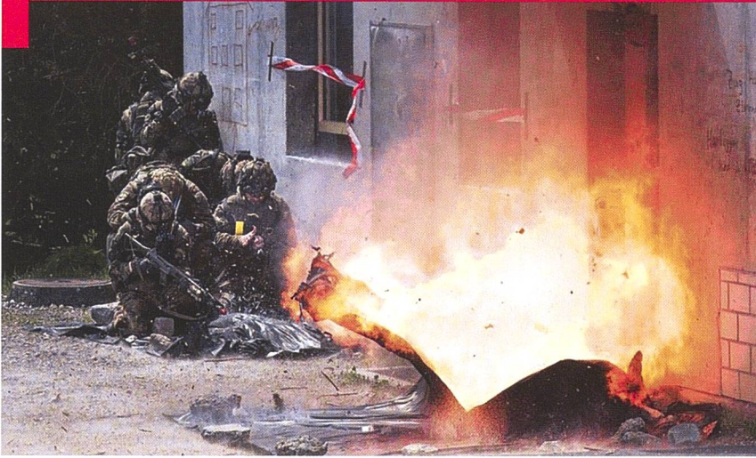
Photographe expérimenté dans la couverture de nombreux conflits (Syrie, Karabach, Ukraine...), Guillaume Briquet a été intégré aux unités participant à LUX23 du 28 avril au 10 mai 2023.