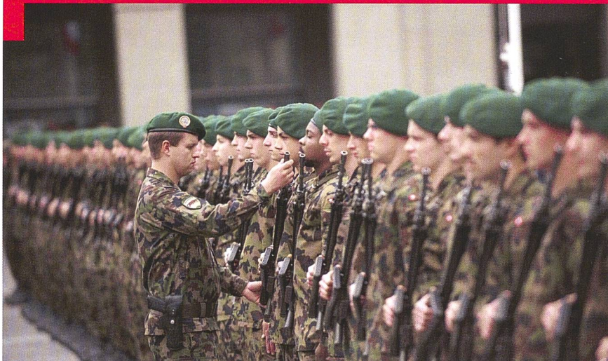
Le milieu militaire a ses codes que les profanes ignorent.