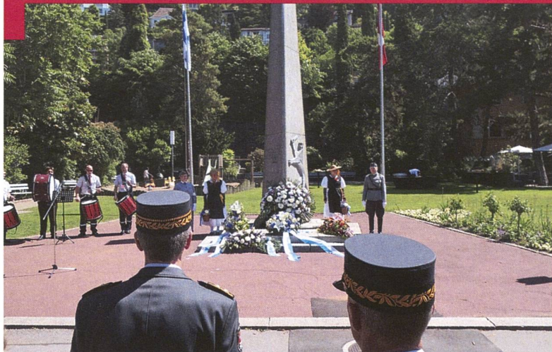
Cérémonie militaire honorant le Maréchal Mannerheim, à Territet près de Vevey, où ce dernier a passé ses dernières années.