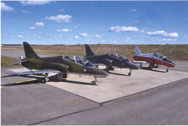
Les avions d'entraînement Hawk Mk. 66 helvétiques volent désormais aux couleurs finlandaises.

molotov ». A cela s'ajoutent les fusils antichars, alors produits en grande série dans les fabriques suisses. L'armée suisse acquiert, lors du conflit, un nombre important de pistolets mitrailleurs finlandais, plus tard construits sous licence dans les usines genevoises d'Hispano Suiza à partir de 1943.