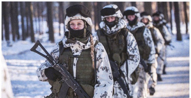
L'armée finlandaise, avec ses petites unités conduites de manière décentralisées, ses effectifs importants, bien équipées en armes antichars et d'appui, représente une force de défense territoriale considérable.