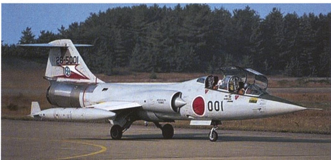
Ci-dessus : F-104J et DJ. Ci-dessous : F-4EJ et Kai modernisés. L'appareil du bas est un RF-4J de reconnaissance non armé.