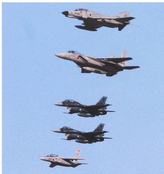
Tableau 1 : Escadrilles de chasse de la JASDF