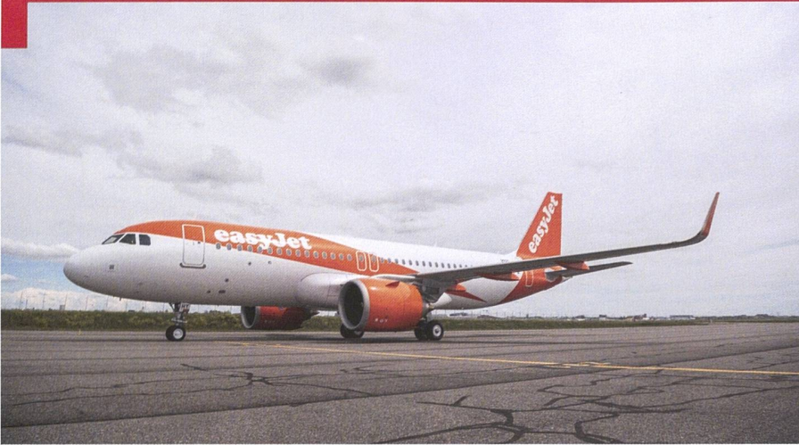
Airbus A320 de la compagnie Easy Jet.