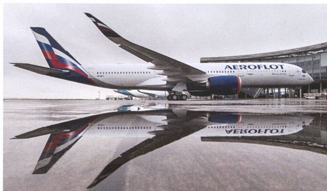
Airbus A350 XWB de la compagnie Aeroflot.

Selon les experts, le transfert des chaînes de montage du siège historique à Seattle vers Mobile (Alabama), sans tradition aérospatiale mais promettant des coûts salariaux inférieurs, a compliqué la résorption des dysfonctionnements. En 2021, Boeing évoquait un nouvel appareil dont la capacité se situait entre le 737 MAX et le 787. Certains l'ont interprété comme le retour des visionnaires chez Boeing, d'autres ont vu juste un coup de marketing contre Airbus. En 2021, la direction de Boeing excluait tout nouveau projet jusqu'en 2030. D'abord, la direction générale, partiellement renouvelée mais toujours d'orientation néolibérale, entend surmonter les déficiences structurelles.