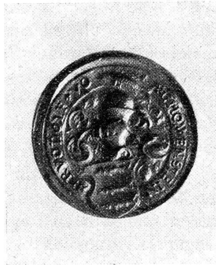
Abb. 2 Siegel des Ritters Rudolf von Schauenstein