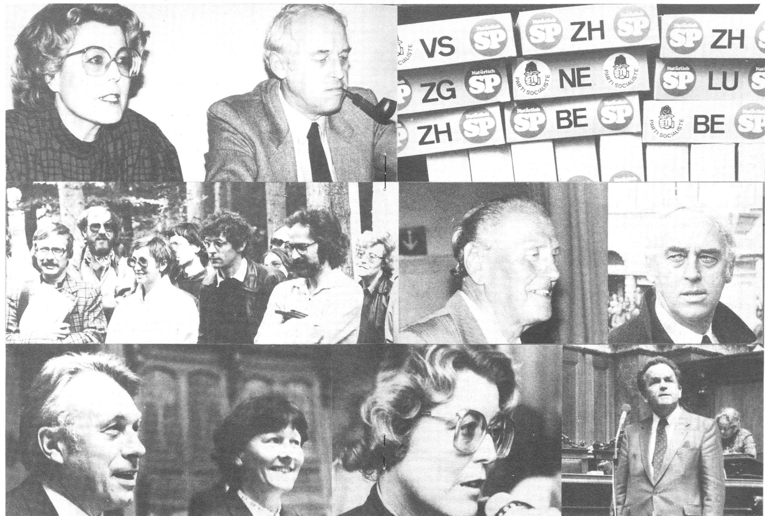
(Alle Bilder, Graphik und Gestaltung: Hans Kaspar Schiesser)