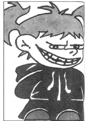
Auch ein Cheerleader; das Davos-Gir

Im Cheerleading-Film hingegen ist die Frage nach Zugang zu Räumen klar: Torrance, Kapitän der Cheerleader in «Bring It On», unterbindet eine Diskussion bei der Bewerbungsrunde neuer Teammitglieder, in dem sie feststellt: «This is not a democracy, this is a cheer-ocracy!» Damit verweist sie auf die Gesellschaft hinter jeder Sportart, die es zu verändern gilt.