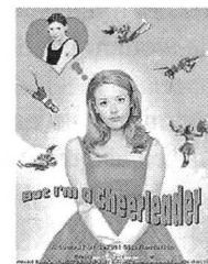
Verliebt in ein Mädchen.

Jenseits des SportlerInnen-Alltags wirkt Cheerleading also als verdichtetes «Superzeichen» einer spezifischen WASP-Weiblichkeit. Was es beinhaltet, machen z.B. auch Filme deutlich, die es in Szene setzen: In «American Beauty» oder «Dead Poets Society» ist ein Cheerleader als Objekt des Begehrens der männlichen Hauptfigur unerreichbar und schön. Für Megan scheint die Feststellung «But I'm a Cheerleader» im gleichnamigen Film der ultimative Beweis dafür, dass sie gar nicht lesbisch sein kann.