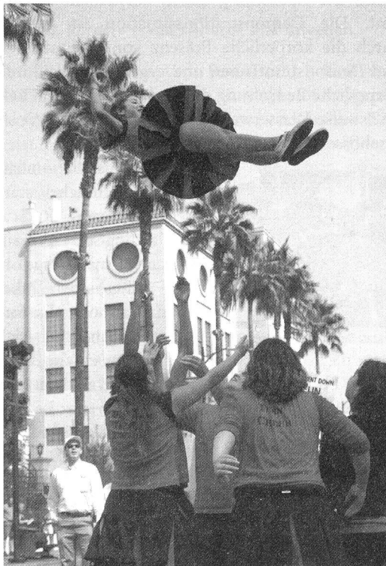
Radical Cheerleading fordert vollen Körpereinsatz.

Damit sind Radical Cheerleader nicht einmal die einzigen, geschweige denn die ersten: Bereits im Video zu «Smells Like Teen Spirit» bringen Cheerleader mit Anarchiezeichen auf dem Trikot das Konzertpublikum dazu, die Bühne zu stürmen; in «Sugar&Spice» helfen die akrobatischen Fähigkeiten der Cheerleadertruppe, beim Banküberfall die Überwachungskameras auszuschalten. Und Megan verabschiedet sich mit ihrem Coming Out nicht von ihrem Sport als heterosexuelles Relikt, sondern gewinnt mit einer gecheerten Liebeserklärung die Angebotete für sich.