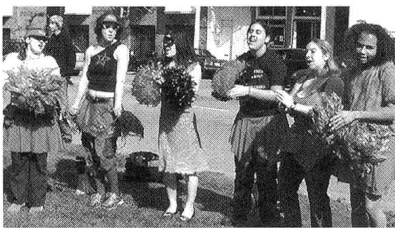
Farbenfroher Haufen, statt Schwarzvermummte.

Neben Konzeptionen von Weiblichkeit werden in Radical Cheerleading auch Themen wie «linke Identität» oder Militanz behandelt. Letzteres findet im Kontext von Demonstrationen vor dem Hintergrund der Bedrohung durch körperliche Gewalt statt. Die Demonstrationssituation ist geprägt durch die körperliche Präsenz von PolizistInnen und DemonstrantInnen und gegebenenfalls durch körperliche Bedrohung durch den Einsatz von beispielsweise Wasserwerfern, Tränengas oder Wurfgeschossen.