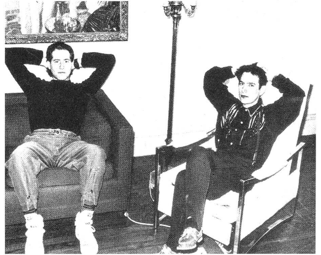
Abb. 2: Ausschnitt aus dem Cover (Rückseite) von: Unknown Gender «SHE DEVIL» (1986).