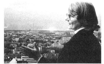
Forscherin mit Weitblick.

effekte mit der Gegenwart und diese wiederum könnten die einzelne Geschichte aus ihrer vermeintlichen Bedeutungslosigkeit herausholen.