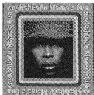
Erikah Badu Mam's Gun Motown, 2000

Körper oder der Mann in ihrer Stimme bereits durchs Leben: PRINCE! Heute noch werde ich schwach, wenn seine Stimme völlig unangekündigt über den Äther streicht. Auch wenn ich mir die letzte Platte erst vor kurzem gekauft habe, und auch wenn ich etwa seit seinen Verwirrungen um den eigenen Namen viele Platten nicht gekauft habe (zumal sich die wenigsten auch wirklich lohnten!) – Prince eroberte sich einen unanfechtbaren Platz in meinem Leben, seit er mich mit diesem Album angefixt hatte: Der Song Alphabetstreet gab mir den nötigen Drive, das eigene Selbstbewusstsein während der privaten Spiegelshows und -Faschings in viel zu grossen Jacken, Schuhen und Hüten meines Vaters zu stärken und mich wie ein Star zu fühlen. Love Sexy half über die ersten Liebes-schmerzen hinweg und sexualisierte mich und meine Gedanken zugleich. Und When 2 R in Love gefolgt von I wish U heaven boten mir die Gelegenheit, meine Liebsten ganz heimlich und für mich, voller Sehnsucht zu grüssen: so zuckersüss, dass vor Liebesfreude teils gar die Augenwinkel salzigfeucht anliefen. Prince, das war Liebe – in jeder Beziehung. Und ist es heute noch, erstaunlicher Weise.