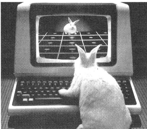
Selbständige Vervielfältigung in der virtuellen Welt.

Diese ambivalente Situation ist wie gesagt nicht gerade unproblematisch. Haraway wird an dem Punkt, wo man endlich Näheres über das genaue Funktionieren dieses doppelten Blickwinkels erfahren möchte, reichlich vage und schönrednerisch. In den «unheimlichen neuen Netzwerken», die alte hierarchische Systeme ablösen und neue Formen von Regulierungsmechanismen hervorbringen – sie nennt diese «Informatik der Herrschaft» – sieht sie gerade auch die Möglichkeit zu subversiven Fusionen: «Vernetzung» ist nicht nur eine multinationale Unternehmensstrategie, sondern