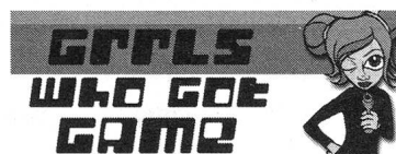
Grrls spielen nicht (nur) «Barbie Fashion Designer».

Bei den Skins in Netzwerkspielen geht es nicht darum, vorgefertigte kulturelle Geschlechtmuster zu adaptieren, sondern sich eine Haut – etwa nach strategischen oder phantasmatischen Erwägungen – überstreifen zu können, ohne am biologischen Geschlecht gemessen zu werden. Es existiert eine erstaunliche Vielzahl an Webseiten, die den Download von fertigen Skins oder Anleitungen zum Selberbauen anbieten. Im Computerspiel findet sich eine unmittelbarere Möglichkeit der Eigenproduktion von Skins, wenn die BenutzerInnen die dazu erforderlichen Kompetenzen besitzen. Es ist aber zu beachten, dass die Möglichkeiten des Eigenproduktion Teil des ökonomischen Systems sind. 3 Das Fan-Feedback spart Produktionskosten und die Zielgruppe ist besser im Auge zu behalten. Die verwendeten Programmcodes setzen gewisse Grenzen, innerhalb derer sich die NutzerInnen bewegen müssen. Ein ständiges Wechselspiel von Aneignung und Wiederaneignung läuft zwischen ökonomischem System und NutzerInnen ab. Anne Marie Schleiner sieht in der Möglichkeit, sich die eigene Repräsentationen in Spielen zu schaffen, einen