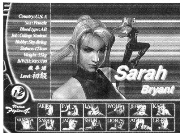
Sarah Bryant, Kickboxerin aus «Virtua Fighter».

Weitere Phänomene neben Skins sind das «body double» und die «look-alikes». Dabei kleiden und verhalten sich die AkteureInnen wie virtuelle Persönlichkeiten. Bekanntes Beispiel ist der Rummel um die Computerfigur Lara Croft. «look-alike» and «body double» werden materiell über die zweite Haut konstruiert. Die Mode ist der visuelle Link zu den virtuellen Charakteren: Sie sehen wie Lara aus, weil sie die gleiche Kleidung tragen. Die Skins weisen auf eine andere aktive Strategie, die als Personalisierung von medialen Spielstrukturen zu bezeichnen ist. Die persönlichen Looks in den virtuellen Extensionen des Selbst sind nur noch locker mit der repräsentierten, vielmehr mit der repräsentierenden Person verbunden. Skins können eine Flucht vor dem eigenen Körper in phantasmatische und surreale Dimensionen sein, sie sind aber ebenfalls eine Mischung von persönlichen und virtuellen Elementen. Natürlich macht sie gerade