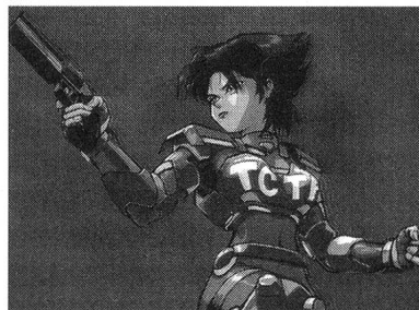
Protagonistin des Anime-Actionspiels «Oni»: die Ninja-Kämpferin Konoko.

Die beiden Formen des «body double» bzw. des «look-alike» und die «Art of Skinning» zeigen den aktiven Part einer User-Programm-Interaktion im Spiel, der ausserhalb der komplexen