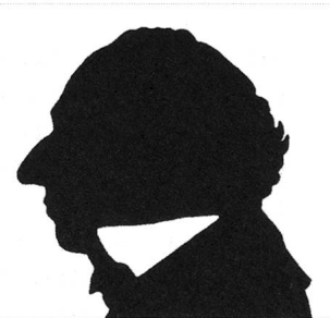
Andersens Blick gilt dem Bruder.

Und ist sie dann überflüssig, wenn sie dies getan hat? Unbestreitbar ist jedenfalls die Tatsache, dass es bemerkenswert untragisch ist, wenn Frauen bei Andersen sterben. Die sexualisierte Frau lebt bei ihm gefährlich. Man könnte fast meinen, dass für Andersen