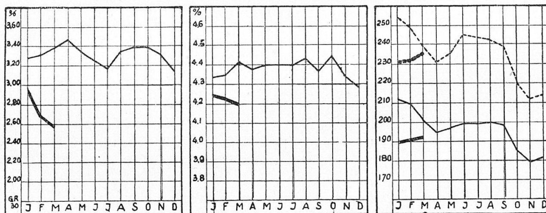
Taux de l'escompte privé Taux des obligations (rendement des obligations à 3½ ‰ des C. F. F., série A-K) Index des actions

En Suisse, l'escompte privé (taux d'intérêt des banques commerciales) tomba à 2,6 pour cent; il n'a plus été aussi bas depuis 1926. C'est pourquoi en date du 13 avril la Banque nationale suisse a porté son taux d'intérêt de 3½ pour cent qui avait été maintenu inchangé depuis l'automne 1925, à 3 pour cent.