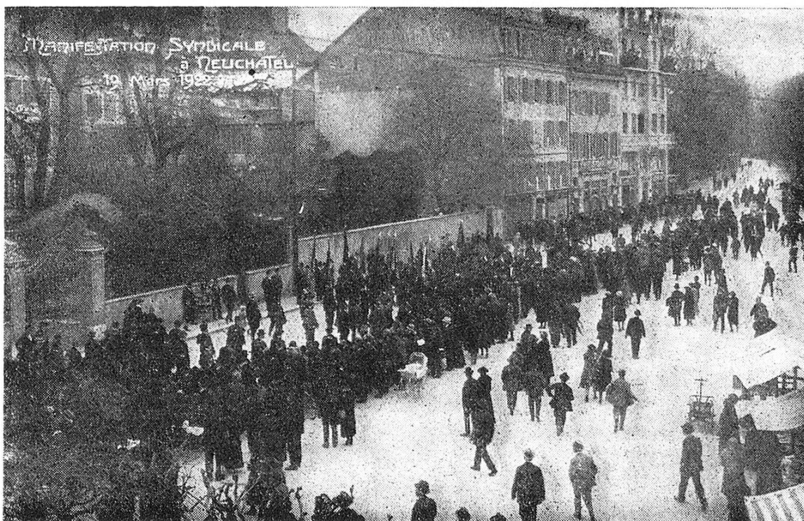
1922 Période agitée. Les chômeurs sont nombreux. La misère est à l'ordre du jour dans les ménages des travailleurs. Le 19 mars un long cortège de chômeurs parcourt les rues de Neuchâtel pour réclamer du travail. Sur la photo ci-dessus, l'on ne voit que la tête du cortège.

Si les propositions que nous avons faites n'ont pas été adoptées immédiatement, elles ont néanmoins inspiré dans une large mesure la législation fédérale qui fut établie plus tard et en particulier la création de la «superholding» de l'industrie horlogère.