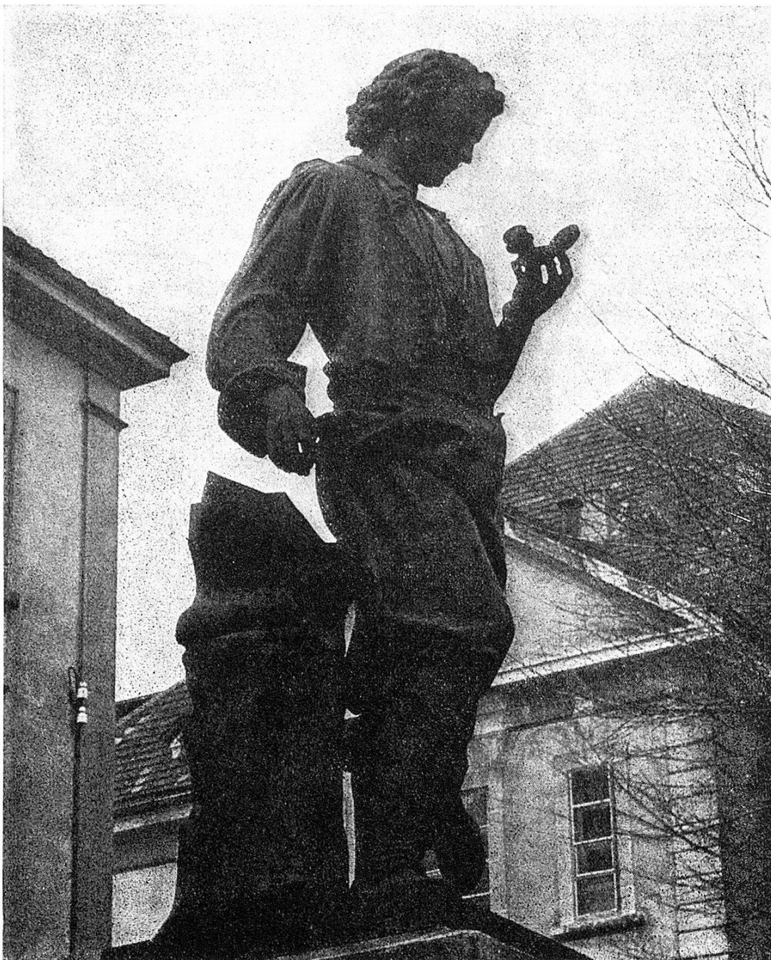
Le Locle avec son monument Daniel Jeanrichard, le premier horloger en pays neuchâtelais.

En 1966, la législation fédérale a obligé le Canton de Neuchâtel à abroger sa loi sur les vacances; nous avons alors conclu avec l'Union Patronale Neuchâtelaise une convention qui reprenait, en l'améliorant même un peu, tout ce qui contenait la loi supprimée. Cette convention générale en matière de vacances a été largement appliquée.