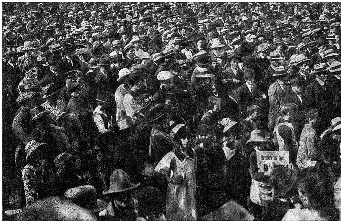
1924 C'est par milliers que les travailleurs participent aux manifestations du 1 er mai en pays neuchâtelois. Les temps sont durs. La solidarité ouvrière n'est pas un vain mot. Chacun espère en un avenir meilleur.

La politique contractuelle ne fixe pas seulement les salaires (minima ou moyens), mais aussi tout ce qui concerne la situation sociale des salariés: Durée du travail, vacances, allocations familiales, assurance-maladie, d'autres choses encore. Plusieurs conventions prévoient l'institution de comités paritaires et de tribunaux d'arbitrage destinés à résoudre les conflits qui n'auraient pas pu l'être par les négociations.