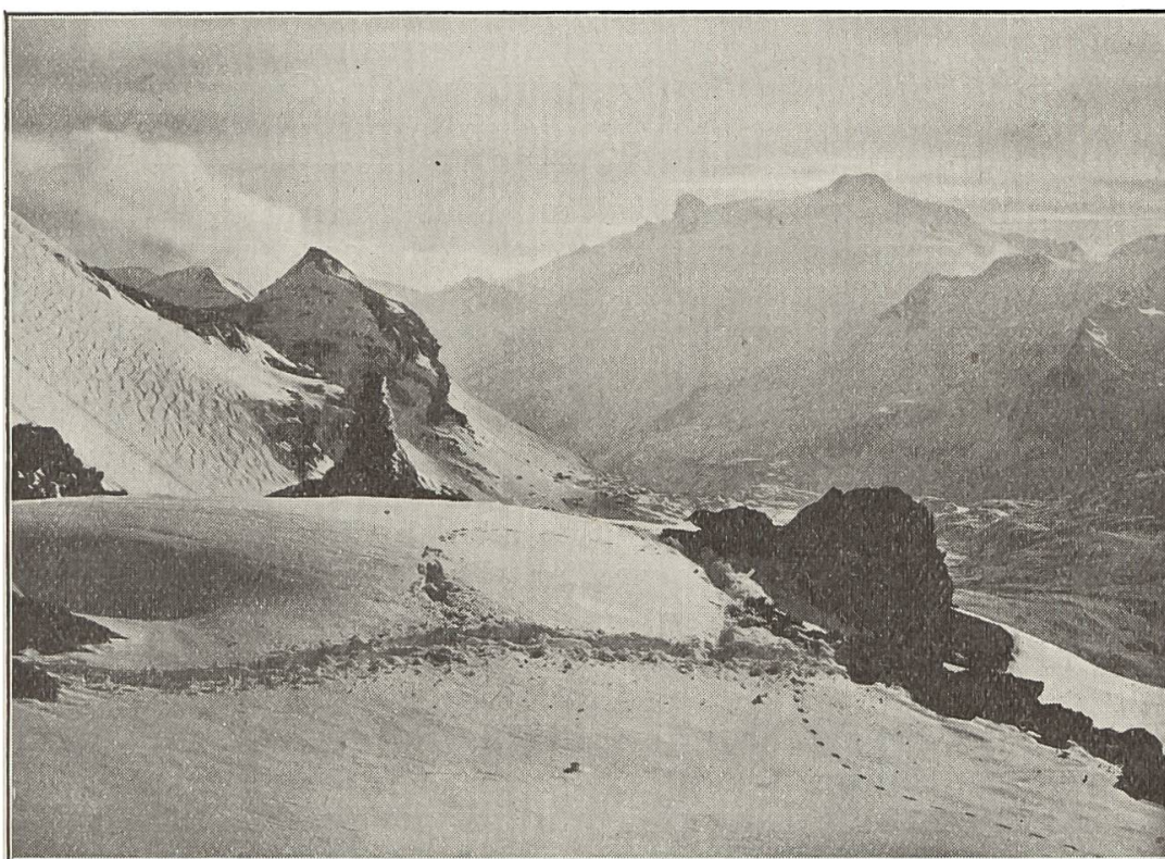
Blick von der Hüttenterrasse gegen Rawylpass und Wildhorn.

Sonntag : Feiertag ! Schon früh regt es sich in beiden Hütten. Hüttenwart und dienstfertige Geister empfangen die von neuem heranmaschierenden Festteilnehmer und laben sie mit warmen Getränken. In und um die Hütten wird es immer lebendiger. In die freudige Begrüssung der Ankommenden mischen sich die Wetter-