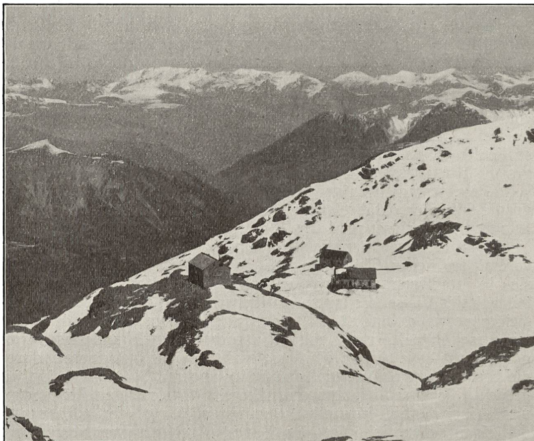
Das Rohrbachhaus mit der neuen Wildstrubelhütte und die alte (abgebrochene) Hütte (links im Bild).

gut sein ! Hier möchte man länger verweilen können als nur die kurze Zeit einer « Durchreise ». Mögen viele das gastliche Haus aufsuchen, sich darin geborgen fühlen und der vielen Mühe und Kosten eingedenk, die es gekostet hat, mit Haus und Inventar allzeit wie ein pater familias umgehen. Diese Empfehlung rechtfertigt sich, wenn man bedenkt, dass das gediegene Hütten-Inventar allein einen Wert von rund Fr. 5000 darstellt, und dass es — da die neue Hütte in erster Linie für winterliche Unterkunftsverhältnisse gebaut wurde, mithin das ganze Jahr geöffnet bleibt — vermehrter Beanspruchung unterworfen sein wird.