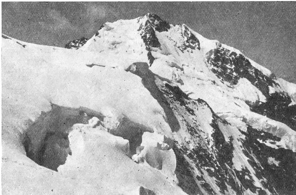
Bernina: Südost- und Biancograt.