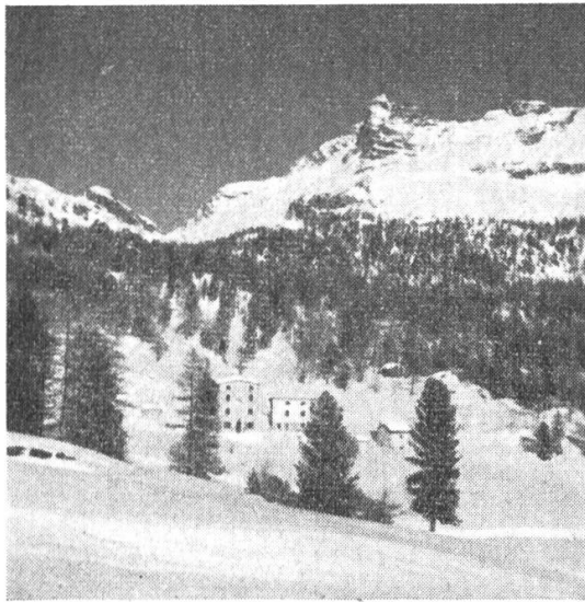
Rifugio Saoseo mit Corno di Dosdè

Gerade das Unscheinbare, Verborgene in der Natur belohnt ja den Suchenden in hohem Mass! – Eine eindruckliche Mahnung an all die Gipfelstürmer, neben dem sportlichen auch das besinnliche Bergerlebnis vermehrt zu pflegen.