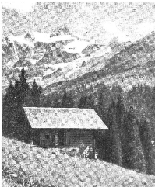
Die Büttthütte mit Blick gegen Hohtürli