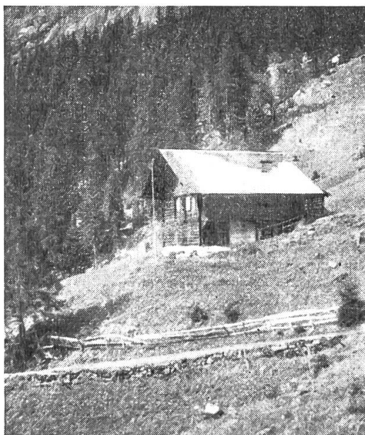
Die Büttthütte von der Alpgasse aus gesehen