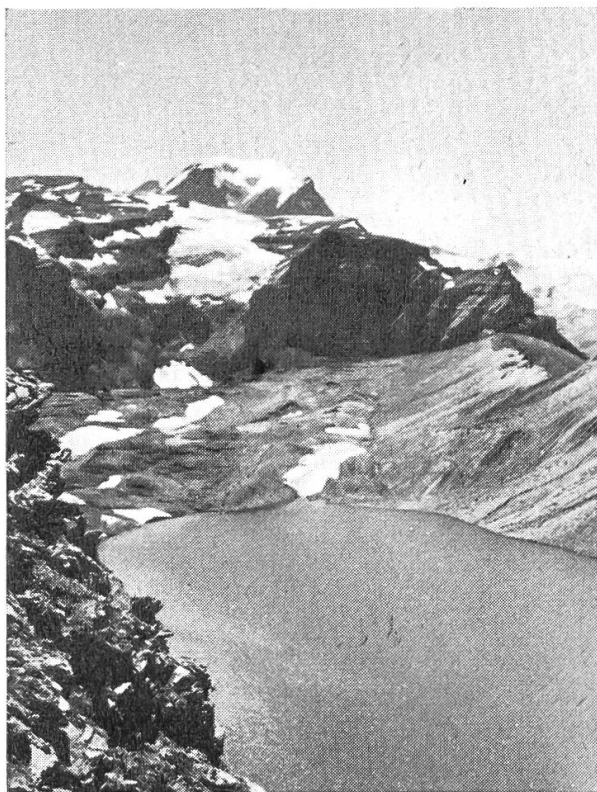
Muttsee mit Tödi

Um 4.30 Uhr weckt uns der Hüttenwart mit der frohen Botschaft, es sei wolkenloser Himmel. Wir sind aus diesem Grunde rasch auf den Beinen und können nun feststellen, in welcher reizender Gegend die Muttseehütte steht. Aus etwa 500m Entfernung leuchtet der wunderbar blaue Muttsee, der den so reichlich vorhandenen Geröll- und Schutthalden die Eintönigkeit nimmt. Von allen Seiten her grüssen schöne Gipfel und Gräte. Mit leichtem Rucksack verlassen wir eine Stunde nach der Tagwacht die Hütte. Wir haben die Absicht über den Ruchi den Hausstock (3152 m) zu besteigen. Den See umgehen wir auf der Westseite. Wortlos nehmen wir die sehr steile Schutthalde der Ruchiflanke in Angriff. Nebst dem imposanten Bifertenstock kommen nun die von der Sonne überfluteten Gipfel der Tödi- und