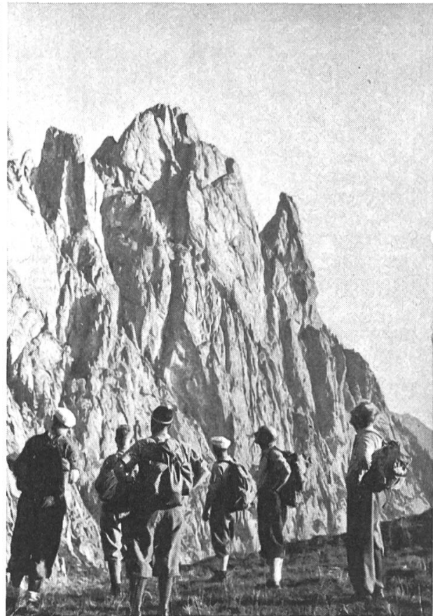
Schwarzenburger mustern die Gastlosen, bevor sie ihnen zu Leibe rücken

haben jetzt also Mutter und Tochter seit den Adoptionswehen miteinander geteilt. Anlass genug, einmal der lieben Subsektion ein Kränzchen zu winden und ihr eine Sondernummer zu widmen. Von wirklichen Schmerzen war natürlich nie die Rede. Selbst während der Pubertät zeigten sich keine Schwierigkeiten, und alles deutet darauf hin, dass in späteren Jahren auch Wechseljahrbeschwerden kaum zu befürchten sind.