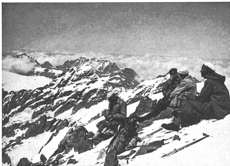
Auf dem Aletschhorn

Mit Reservewäsche, der technischen Ausrüstung und all dem notwendigen Krims-Krams gibt das eine respektable Last. Andererseits trägt keiner gern einen schweren Sack.