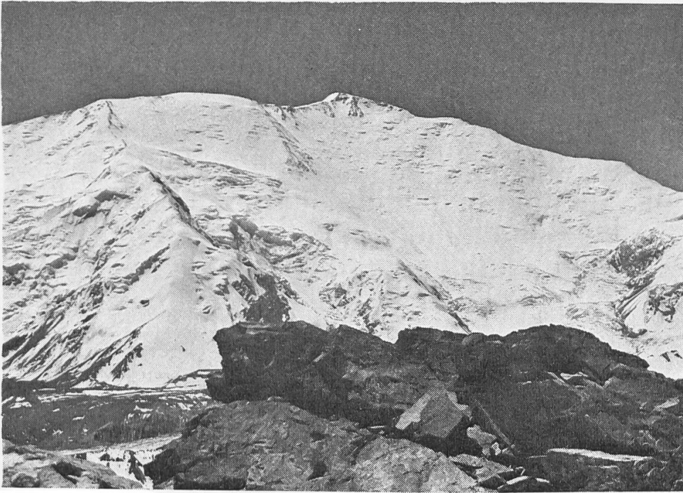
Pic Lenin. Rechts unser Aufstiegsgrat über Rastelnaja. Rechts unten in Lücke Standort des Lagers 3.