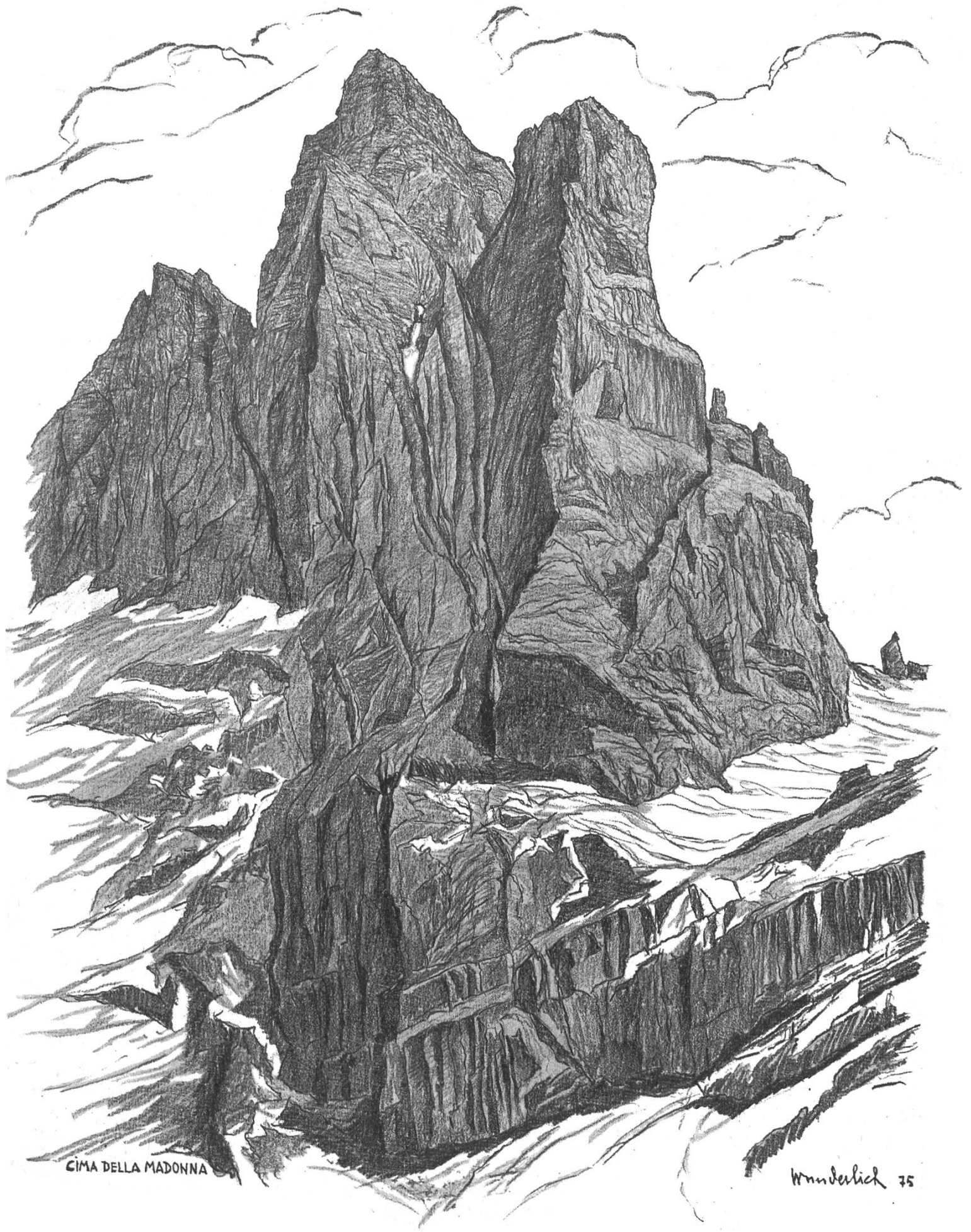
CIMA DELLA MADONNA