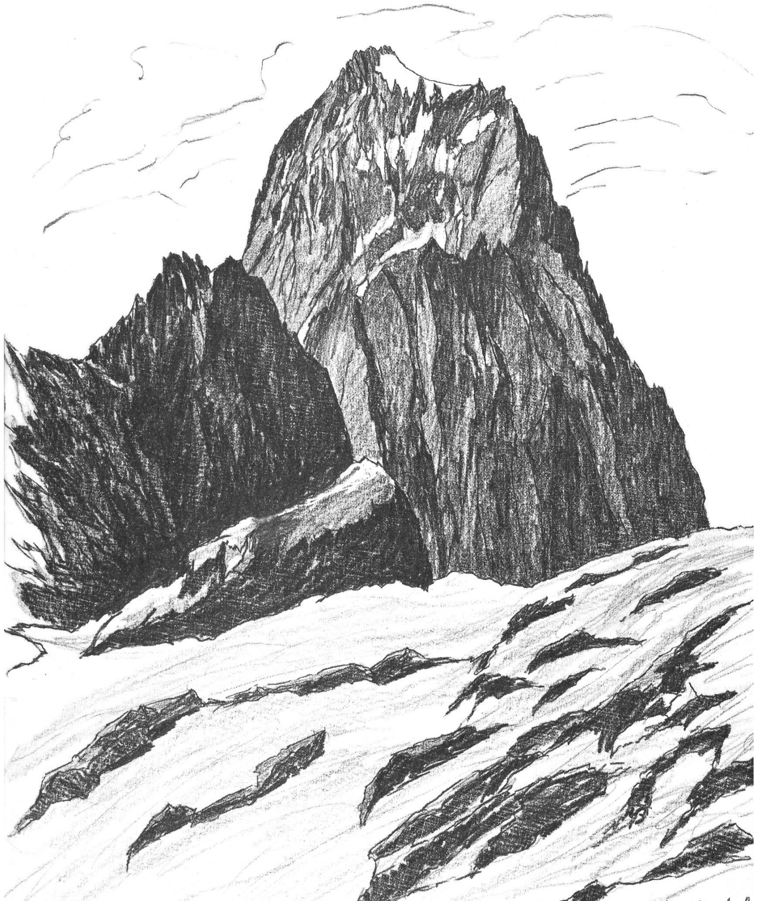
Grosse Windgälle (vom Schächental)