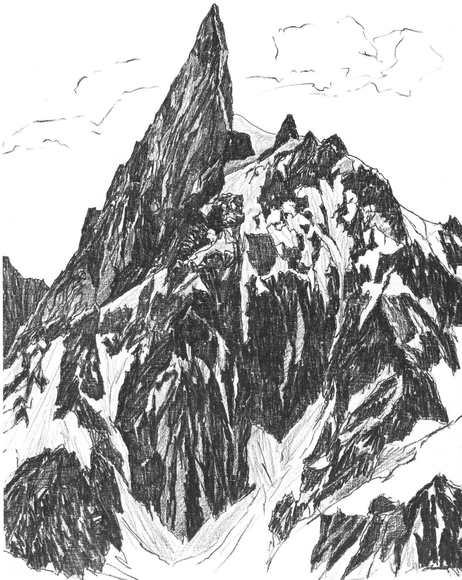
Xent du Géant (Mt. Blanc)