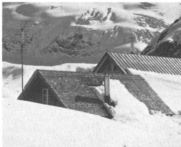
Gaulihütte, 2205 m

Wem ist dieser Slogan nicht geläufig? Wer eine Neuigkeit weitergeben oder sonst Wichtiges anbringen will, bedient sich des zur Selbstverständlichkeit gewordenen Kommunikationsmittels, dem Telefon. Diese Einrichtung hat dank der drahtlosen Über-