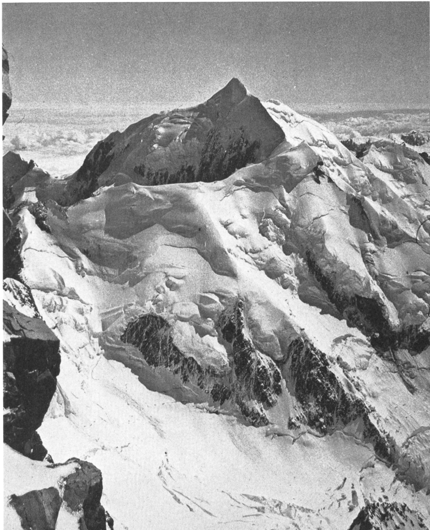
Seniorentourenwochen Neuseeland 1983: Mount Tasman (3500 m) mit Silberhorn (3309 m).