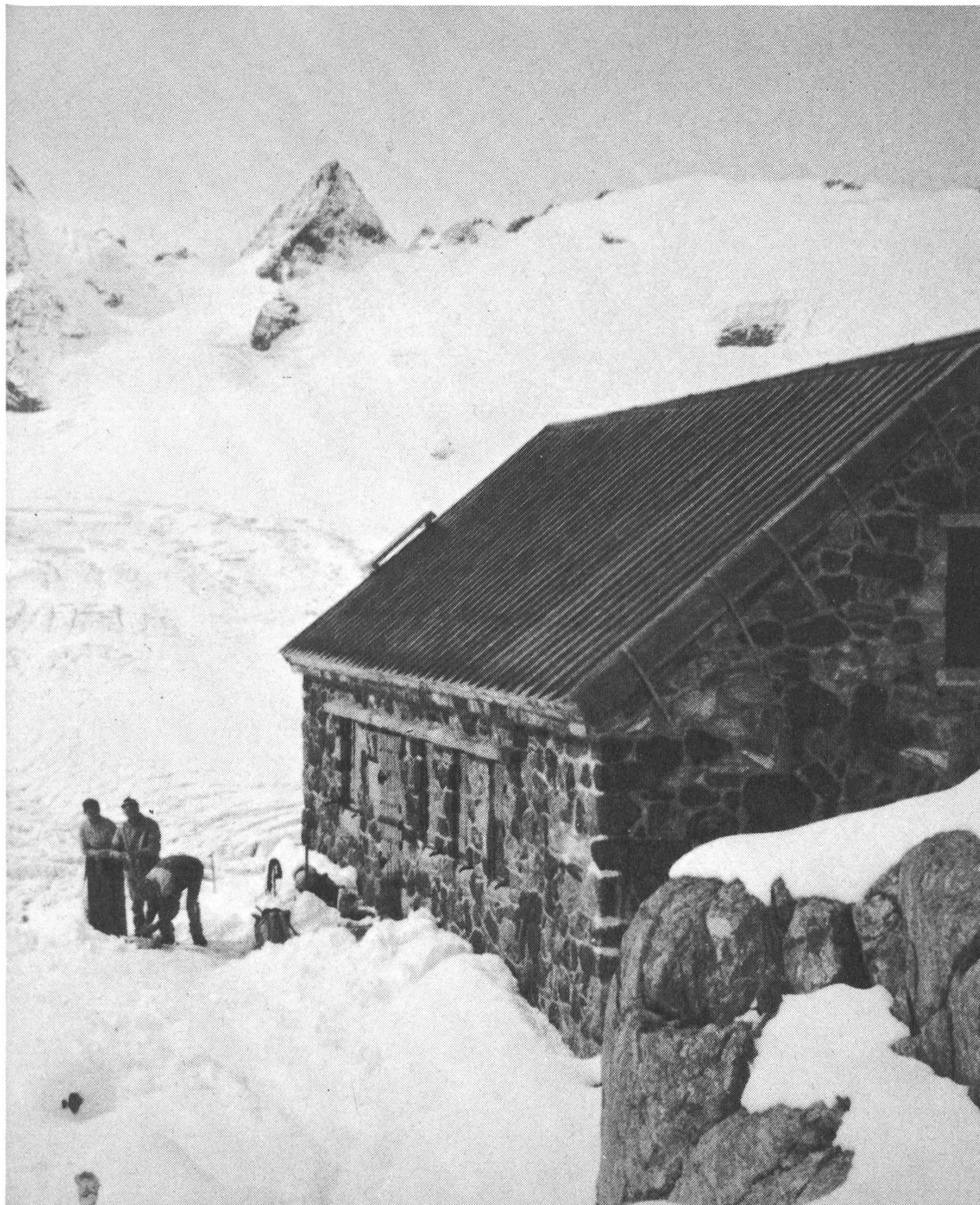
Trifthütte (2520 m)