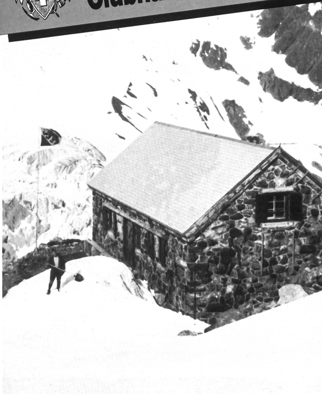
Trifthütte, 2520 m