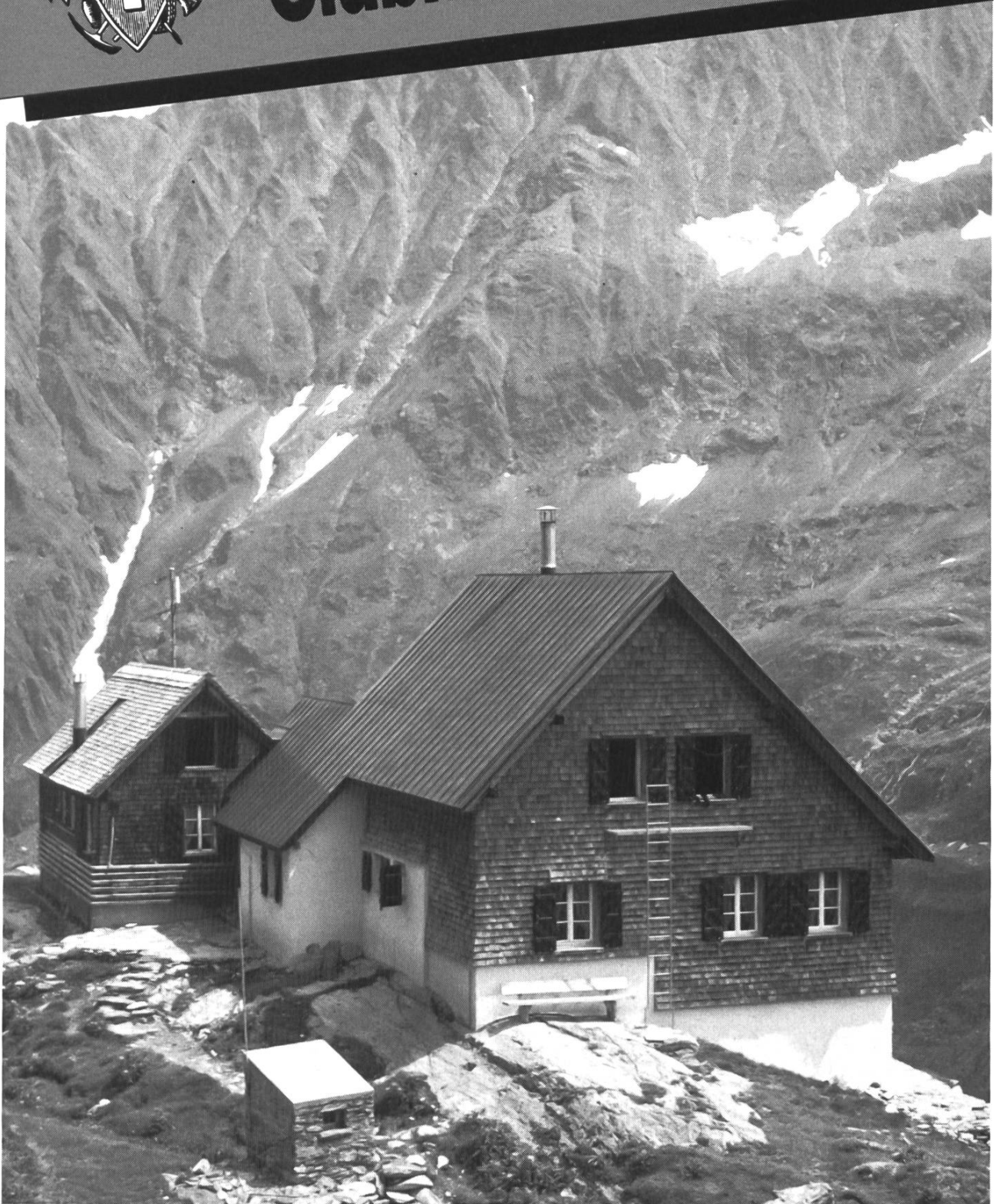
Gaulihütte, 2205 m