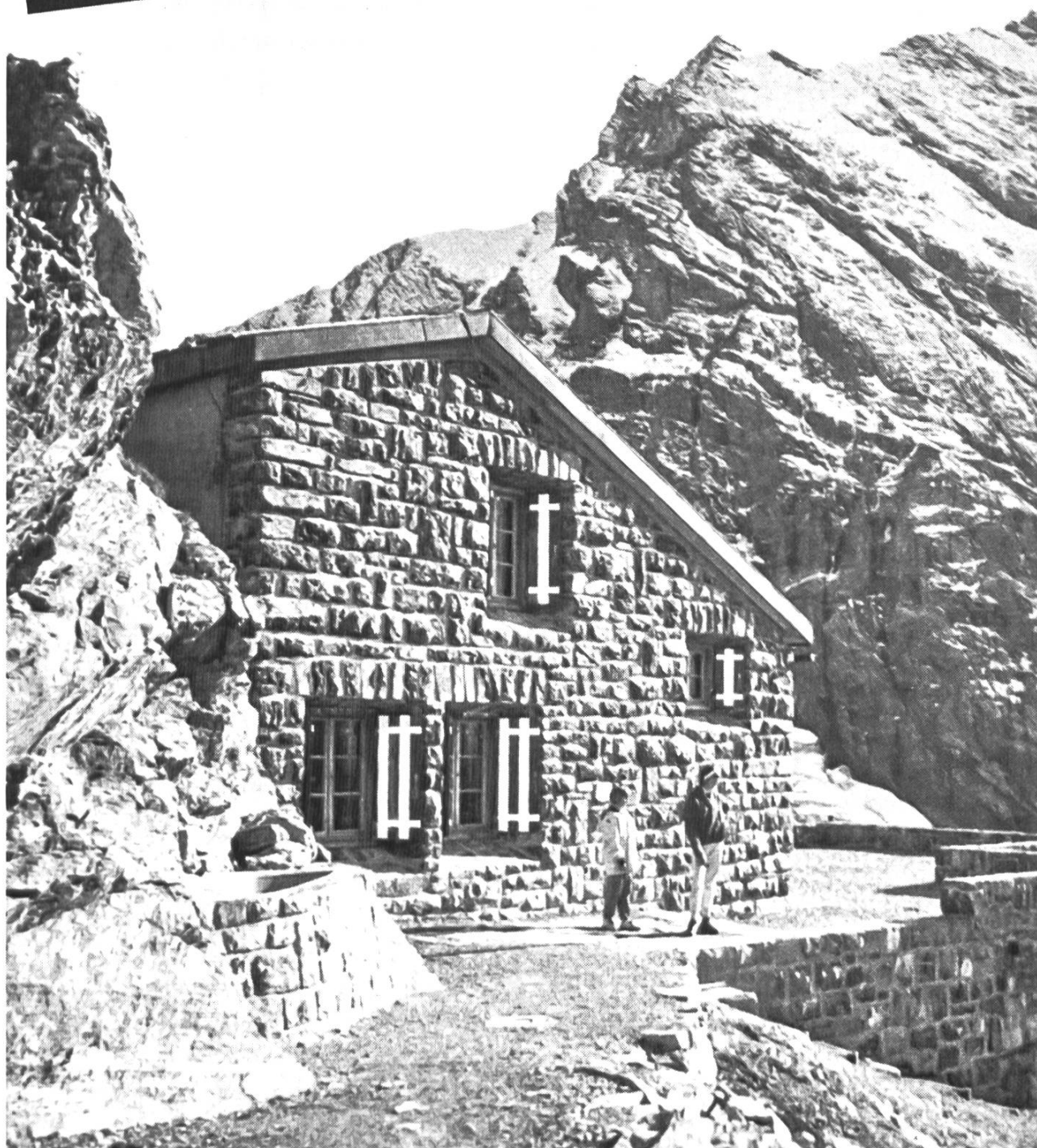
Gspaltenhornhütte, 2455 m