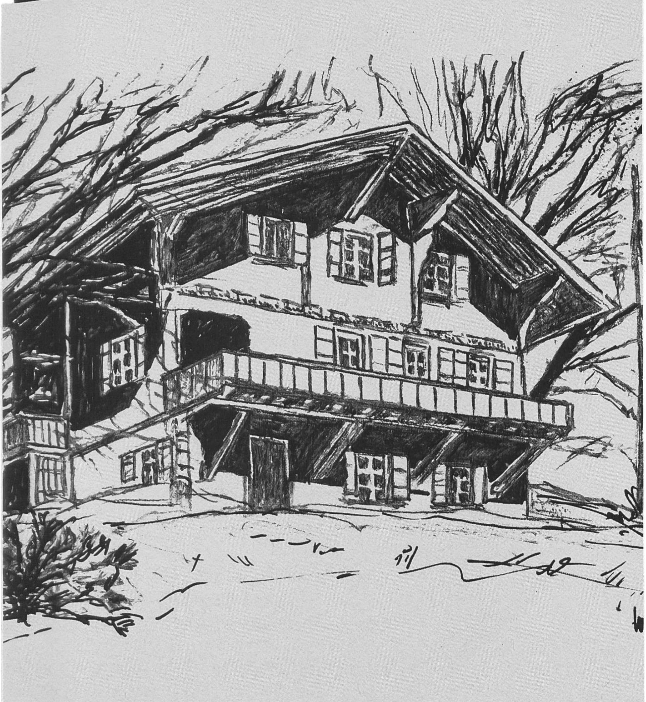
Chalet Teufi, 1200 m