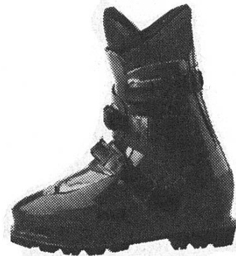
Lowa Super Peak