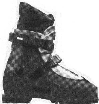
Koflach Valluga 4000