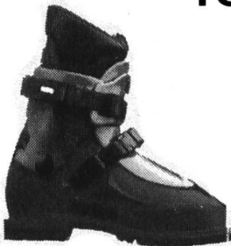
Koflach Valluga 4000