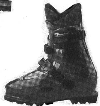
Lowa Super Peak

beim Sportzentrum 3825 Mürren Tel. 036 55 23 55