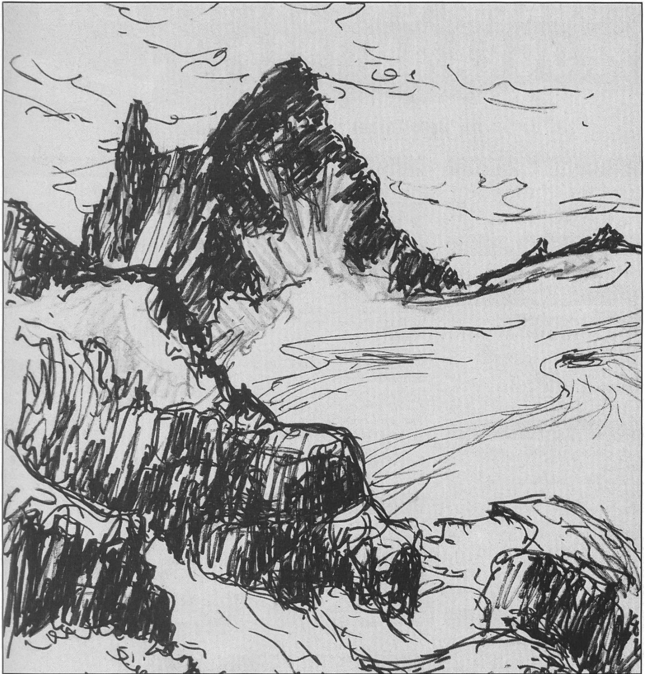
Gross Litzner+Gross Seehorn vom Plattenjoch, Zeichnung: Paul Kleiner