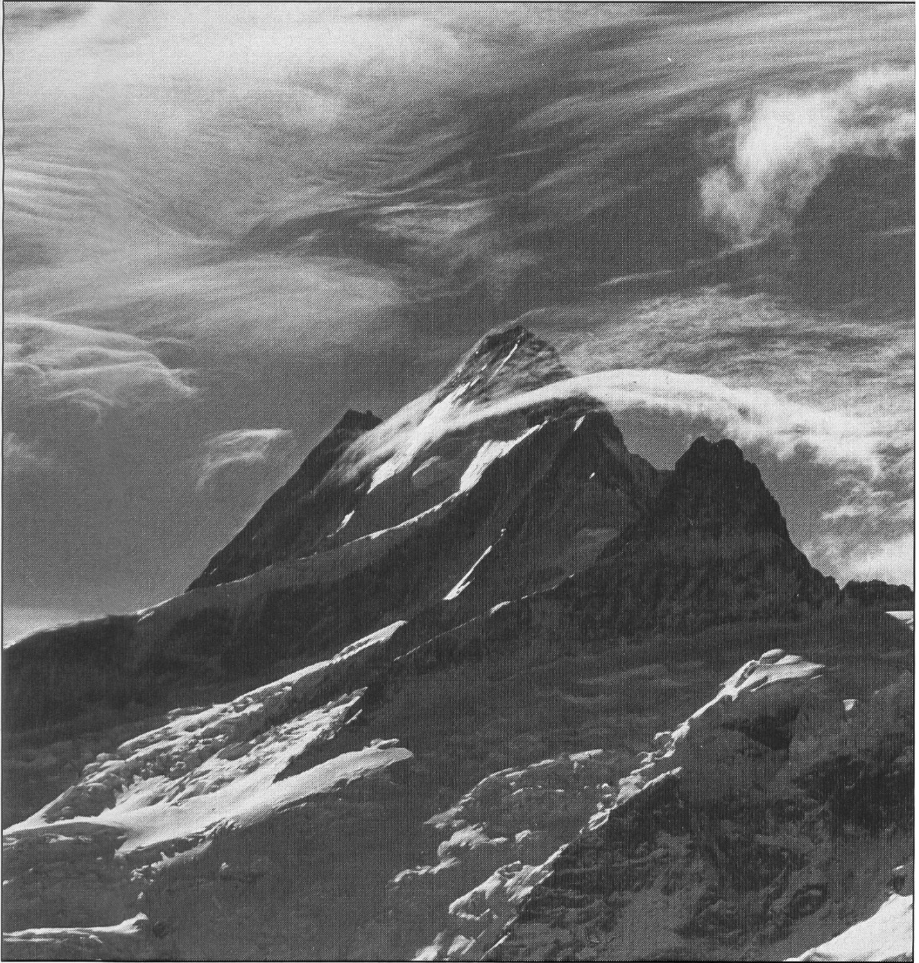
Schreckhorn, Foto: Markus Liechti