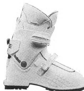
Koflach Albona Pro