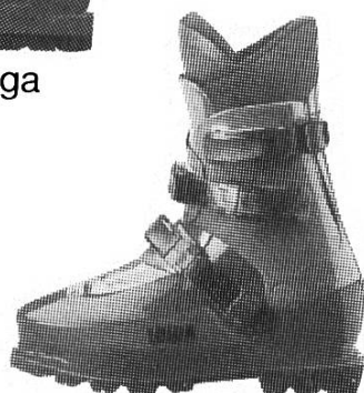
Lowa Super Peak