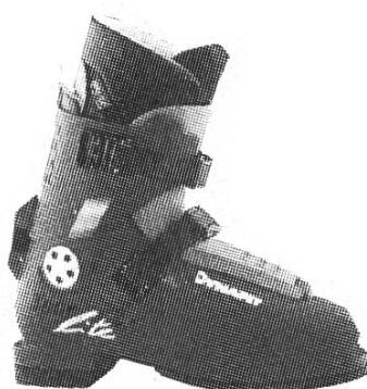
Dynafit Tourlite II