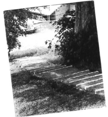
Zugang zum Chalet Teufi: ... nach getanem Werk!