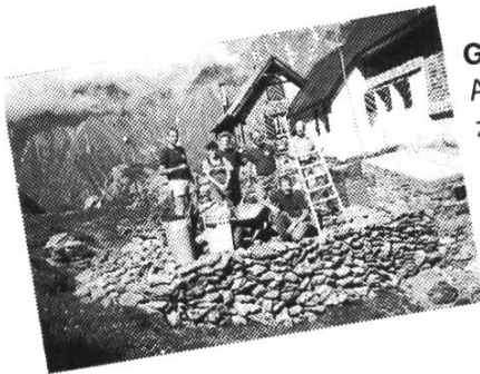
Gauli-Equipe: Alles ist recht zum Steine herbeischleppen!