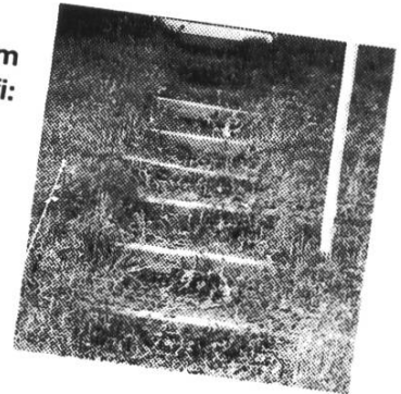
Zugang zum Chalet Teufi: vor...