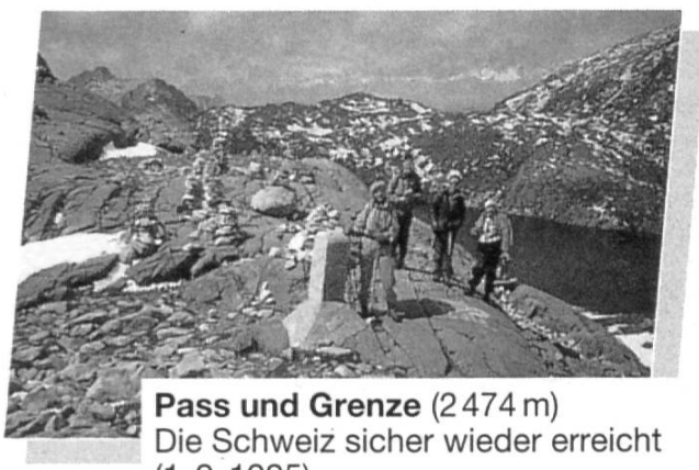
Pass und Grenze (2474 m) Die Schweiz sicher wieder erreicht (1. 9. 1995)