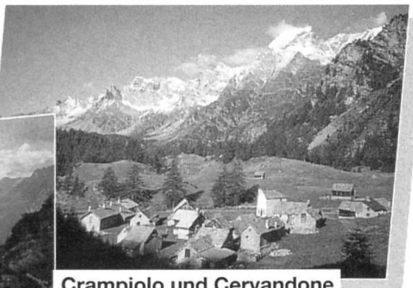
Crampiolo und Cervandone Grüne Landschaft in tieferen Lagen (31. 8. 1995)