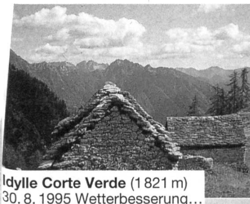
Idylle Corte Verde (1821 m) 30. 8. 1995 Wetterbesserung...