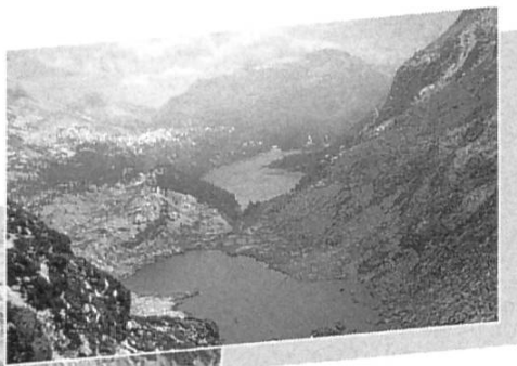
Laghi Pianboglio und Devero Einkehr des Winters auch im Süden (29. 8. 1995)