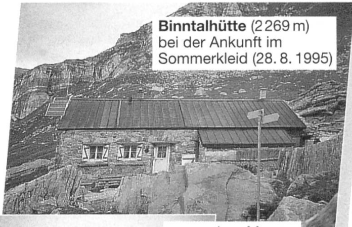
Binntalhütte (2269 m) bei der Ankunft im Sommerkleid (28. 8. 1995)