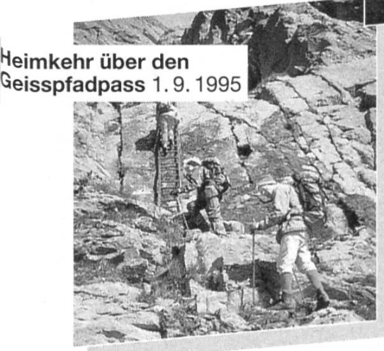
Heimkehr über den Geisspfadpass 1. 9. 1995