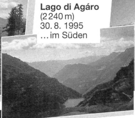
Lago di Agáro (2240 m) 30. 8. 1995 ... im Süden