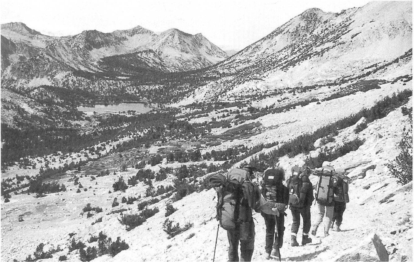
Wilde Gegend nach dem Kearsarge-Pass.

Nach einer wegen der bevorstehenden langen Etappe relativ frühen Tagwacht marschierten wir Richtung Forrester-Pass. Verträumte Morgenstimmung! Die Wege sind übrigens tipp-topp ausgebaut, und so kann man die Aussicht auf die umliegende Szenerie ohne grosse Gefahren geniessen. Die Distanzen sind recht gross; es brauchte einige Pausen, bis wir endlich den Forrester-Pass mit einer beachtlichen Höhe von 4010 m geschafft hatten. Der Ausblick entschädigte aber ausnahmslos alle für die Anstrengungen. Unser Ziel konnten wir auch schon sehen, und da es recht weit weg war,