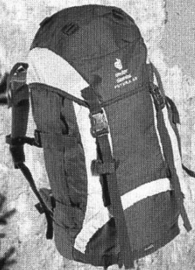
DEUTER Aircomfort Futura sportlicher Allrounder 42 Liter Fr. 199.-