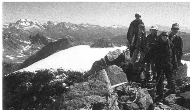
Die Sektion Bern auf dem Piz Medel

Die von Werner Wyder geführte Tour war auf Samstag, 6. bis Sonntag, 7. Juli 2002 ausgeschrieben und mit vier Dreierseilschaften vorgesehen.