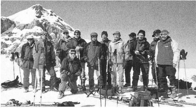
Ein aufgestelltes Dutzend am Schwarzhorn

sind wir zurück in unserem Hotel und geniessen die wohlverdiente Dusche!